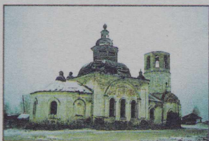
д. Слудка. Церковь во имя Живоначальной Троицы. Фотография 1997 г.