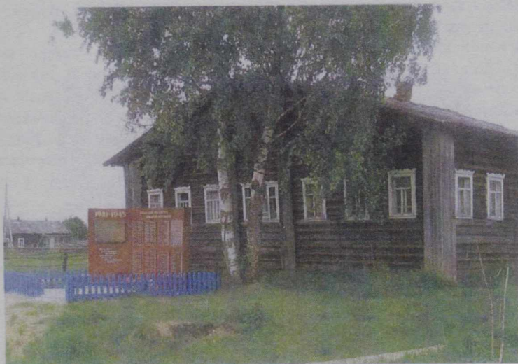
Сыктывкар. 2011 год.

Вид обелиска в Шыладоре на обложке книги Вашего покорного слуги.