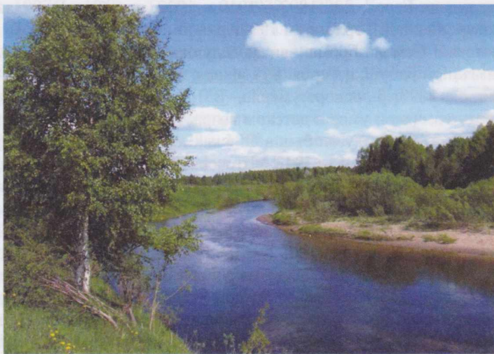
Река Пожег у Шыладора, «Куканьув». Здесь прошло детство Героя.

Перевод на русский язык очерка Михаила Ладанова с газеты «Коми му» от 13.01.2009г., стр. 4