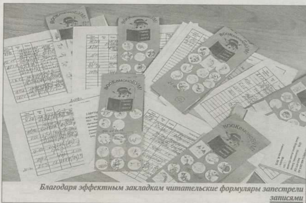
Благодаря эффектным закладкам читательские формуляры заперестрели записями

Дословно «покемон» переводится как «карманный монстр». Букемон, согласно придуманной нами легенде, живёт в библиотеке и любит читать книги. Соответственно, его и назвали «книжным монстром» (от англ. book — книга). Чтобы он отличался от своего прародителя, библиотекари украсили его очками, кепкой с надписью «Букемон» и дали в руки книгу.