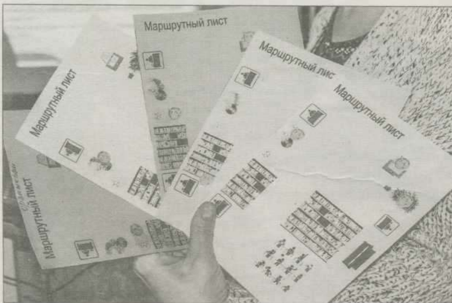
Для того чтобы справиться с заданием, гаджет не потребуется

Правильно ответив, нужно было найти книгу о кораблях или морских путешествиях.