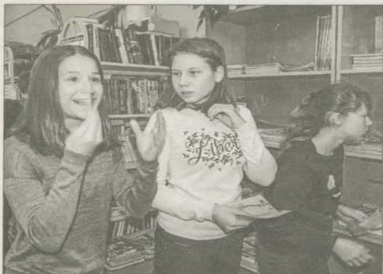
В поисках букемонов игроки тщательно исследовали каждый уголок читального зала

2. В буквенной чехарде найти название произведения художественной литературы. Например: