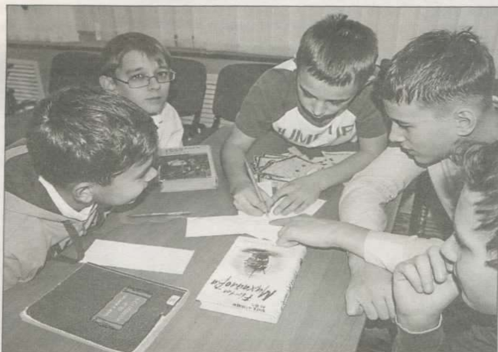
Всего пять строчек, но они дались непросто

В завершение школьникам объяснили, каким образом будут подсчитываться и учитываться заработанные в ходе акции букемоны.