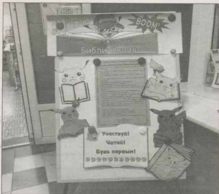
Привлекательно оформленная информация буквально подстёгивает читателей включиться в акцию

✓ Сделать селфи с прочитанной книгой и разместить его на страничке Центральной городской библиотеки «ВКонтакте» (1 букемон) (фото, набравшее наибольшее количество лайков, отмечается особым призом).