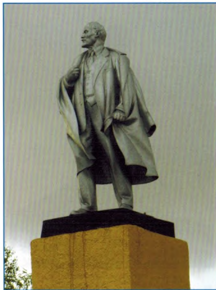
Памятник В.И. Ленину. Фотография 2011 г.

Объект культурного наследия регионального значения