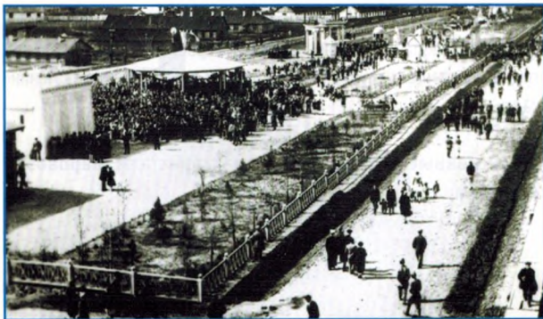
Бульвар Победы. 2-я пол. 1940-х гг.