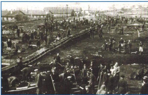
Воскресник на строительстве Бульвара Победы. 1945 г.

лезнодорожных платформ с породой, песком, гравием, черноземом, развозили эти грунты тачками, засыпали и трамбовали топь. В дни отдыха организовывались массовые субботники горожан.