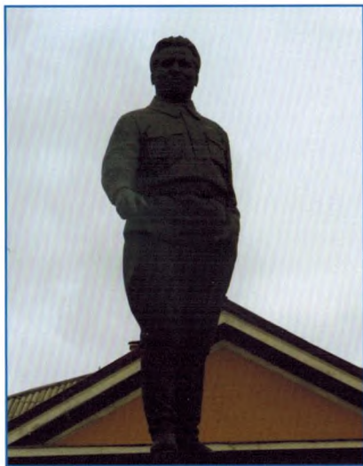
Памятник С.М. Кирову. Фотография 2011 г.

Объект культурного наследия регионального значения