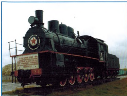
Паровоз «Эм720-24». Фотография 2011 г.

Объект культурного наследия регионального значения