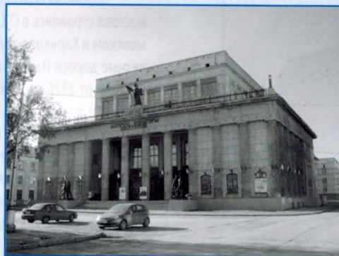
Дворец культуры шахтёров. 1953-1960 гг.