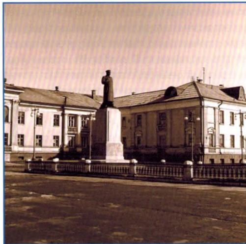
Памятник И.В. Сталину. Фотография 1959 г.

Исторические сведения. Памятник деятелю Коммунистической партии и Советского государства Сергею Мироновичу Кирову был первоначально установлен в сквере на углу улиц Комсомольская и Пушкина и открыт 30 июня 1946 г. Памятник был даром г. Ленин-