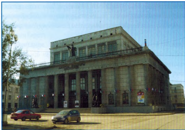
Общий вид Дворца культуры. Фотография 2011 г.