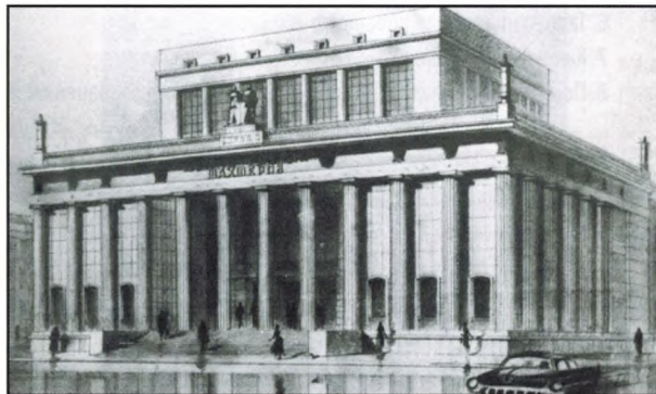
В.М. Лунёв. Дом культуры шахтёров. Эскиз.

Во Дворце культуры применен компактный принцип размещения всех помещений, предусмотренный нормами для этого типа зданий, как наиболее соответствующий климатическим условиям района и экономичный. Эти группы состоят из следующих помещений: