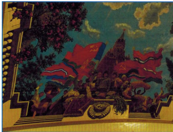
Плафон «Дружба народов». Фрагмент.

Интерьер танцевального зала решен в более пластичных формах. Его белые колонны, расширяясь кверху, образуют раструбы, излучающие свет вмонтированных в них светильников. Потолок расписан теми же художниками на темы весны, зелени, цветов. Торцовые стены зала представляют собой сплошные зеркала, отражающие