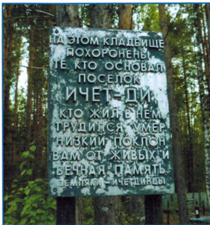
Ичет-ди. Мемориальная доска при входе на кладбище. Фотография 2009 г.

Только одиннадцать памятников (в том числе две братские могилы) из двадцати шести сохранившихся, несут информацию о захороненных (в виде надписей на надмогильных памятниках, нанесенных разного рода способами – от вырезанных на перекладинах деревянных крестов, до гравировок на металлических дощечках. На двух памятниках установлены фотопортреты на металлокерамике с фамилиями и датами жизни похороненных. Наиболее ранняя из атрибутированных могил относится к 1940 г., наиболее поздняя датируется 1961 г.