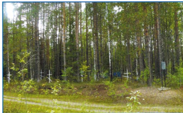
Кладбище жертв тоталитарного режима. Вид с северо-востока. Фотография 2012 г.

Исторические сведения. В декабре 1929 г. на Всесоюзной конференции аграрников-марксистов Сталин объявил переход от «политики ограничения эксплуататорских тенденций кулачества к политике ликвидации кулачества как класса». Политика ликвидации кулачества осуществлялась через конфискацию имущества (раскулачивание) и арест с последующей высылкой раскулаченных.