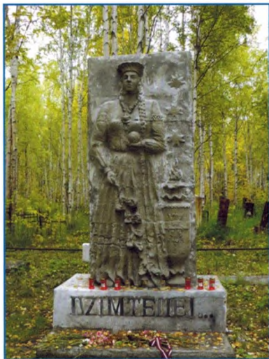
Общий вид памятника. Фотография 2011 г.

г. Инта, ул. Восточная, старое (восточное) городское кладбище Выявленный объект культурного наследия