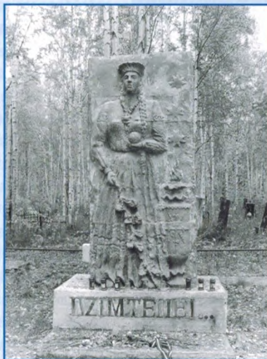
«Дзимтений ...» («Родине...») 1956 г. Инта, старое (восточное) городское кладбище

Кладбище жертв тоталитарного режима. Интинский р-н, пос. Абезь Башня водонапорная. г. Инта «Дзимтений ...» («Родине...»). г. Инта