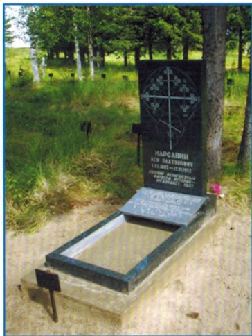
Могила Л. П. Карсавина. Фотография 2012 г.

и березняком. В центре площадки, в направлении с севера на юг, лес пересекает слегка заболоченная просека (тропа для прогона оленьих стад) шириной от 10 до 15 метров. Северо-западная часть кладбища – заболоченная тундра с моховой и кустарниковой растительностью. В этой части кладбище пересекает линия связи на деревянных столбах-опорах. Площадка кладбища имеет уклон с севера на юг, в сторону поймы р. Аса.