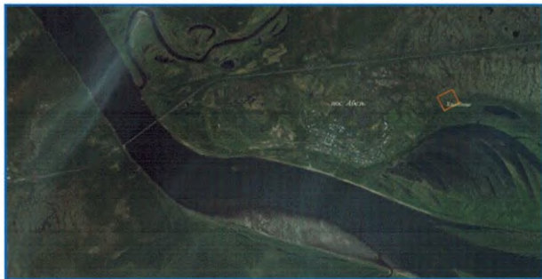
Схема расположения кладбища

Объект культурного наследия регионального значения