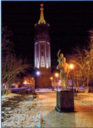
Вечерний вид на памятник. Фотография 2013 г.

Исторические сведения. Водонапорная башня в г. Инте построена в 1953-1954 гг. Проект здания был создан политрепрессированным А. Тамвелисом 1 при участии архитектора И.А. Хоменко и инженера Аленцева.